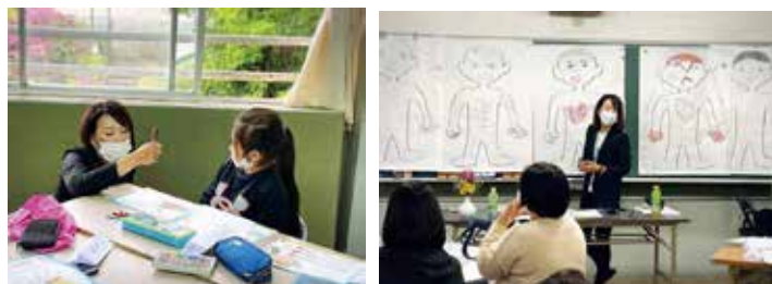
▲ ミニバスチームで子供向け、保護者向けに講座を開催