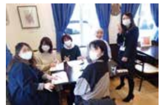
▲ カフェ主催の講座にて

私がアンガーマネジメントファシリテーター養成講座を受講した時、講座のアシスタントの方が「僕はこの講座を受けた時、初めて出したお金の価値以上の学びがあったと感じた」と言われていました。2日間受講した私の気持ちも同じでした。怒りの感情に後悔していても、していなくても、「怒りの感情に興味を持った」ならば、受講をお勧めします。