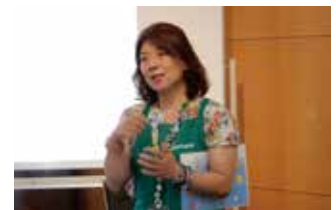
▲ アンガーマネジメントキッズ講座開催