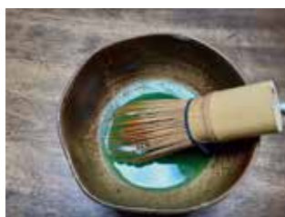
▲ なかなかの出来栄です(^^;)

今後も継続して自分の周りの地域にアンガーマネジメントを広めていくことが、自分のできることではないかと考えています。人に伝える、話すことで自分の勉強にもなり、思いは自分にも返ってくる。少しでも地域の役に立てたらと思います。