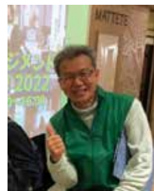
▲ 日本アンガーマネジメント協会 関西支部イベント2022にて