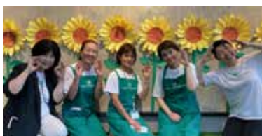
▲ 日本アンガーマネジメント協会 関東支部 親子イベント 2022 年

アンガーマネジメントは心理トレーニングです。トレーニングなので続けていれば少しずつでも上達します。一人ではできているか不安になるかもしれませんが、仲間がいると心強いです。一緒にぜひアンガーマネジメントをしませんか？