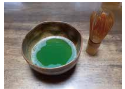
▲ 抹茶を点てながら、「この日1日は怒らないぞ」と24時間アクトカームしました

アンガーマネジメントに興味を持つ方は、今の状況を何とかしたいから迷っているのだと思います。一步踏み出しても後悔はないと思います。ぜひ学んで、地域に広げていただけたらと思います。