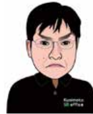
▲ イライラの似顔絵

私は怒りを外に出すことが苦手でした。 誰かに自分のイライラを見せること、ぶつけることはとても怖いことであり、どちらかと言えば、怒るというよりも、自分を責めることばかりで、矛先は常に自分自身。私の周りの誰も、私が自分を責めているということに気づくこともなく、日々過ごしていました。