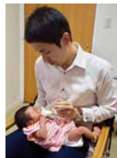
▲ 娘の子育て中にもケンカが多発

何かをしなければいけないと悩む中、書店でアンガーマネジメントに関する書籍を購入。それだけでは身につかないと思い、アンガーマネジメント入門講座に申し込んだのが2019年の8月。怒りのメカニズムに自分の負の感情が大きく関係していることや、怒ることは自分で決めていること等、講座で体感しながら学べたことでとても腹落ちすることができました。そして受講後すぐにアンガーマネジメントをより深めたいと思い、9月のアンガーマネジメントファシリテーター養成講座を申し込んでいる自分がありました。