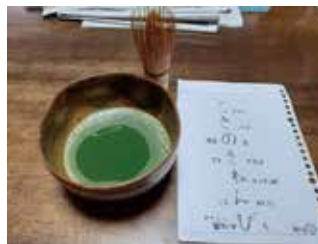
▲ 時の記念日と抹茶～時に思いを巡らせて作った詩を作り、抹茶で一息しました