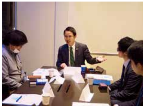
▲ 積極的にセミナーを開催

弁護士という立場は、自分が怒っているわけではなくても、クライアント様が怒りに直面しているケースから始まることから、どうしても怒りに触れることが多くなります。同じように司法という場においても、裁判官、検察官、弁護士ともに、日常的に怒りにふれることも多く、それを必然的に受け止めなければなりません。私がアンガーマネジメントの実践を通して学んだことについて、そうした方々にも、アンガーマネジメントへのお誘いをしていくことが、私の次の目標です。仕事のみならず、様々なコミュニティの中で、アンガーマネジメントを学んだ方が増え、そして皆さんが笑顔で過ごせるような場が増えるような活動を続けていきたいと思っています。