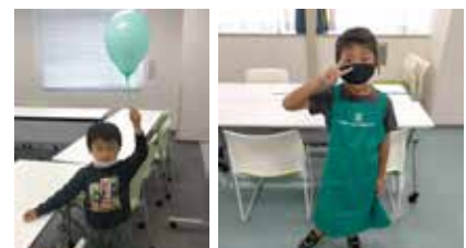
▲アンガーマネジメントキッズ講座が大好きな我が子