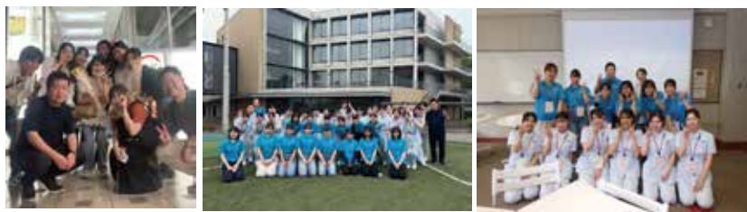
▲ 学生との集合写真

アンガーマネジメントを通して、自分が楽になることをとても実感しております。そのことで学生との関わり方も変化が生まれ、慕ってくれる学生が多くなったと思います。振り返ると自分自身の変化が学生に対して安心安全の場を提供できるようになったのだと思います。さらに自分の中でもゆとりが生まれたのか、家庭でも家族に当たるものが減り、とても充実した日々を過ごしています。今後も学生たちが安心して自分の意見を言える場を提供し、その成長を嬉しく思える活動を続けていきたいと思っています。