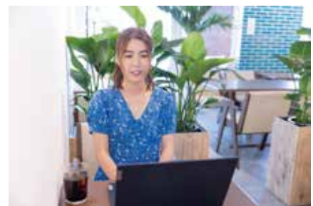
▲現在はオンラインでの仕事が多いです

「自分のことは、自分が一番よく分かっている！」以前までそう思っていました。でも「感情」って意外と分からないんです。だからイライラしたり、疲れたり、人間関係がこじれたりする。でも、アンガーマネジメントを学ぶと、感情が湧き出るメカニズムや、その対処方法が分かるんです。自分のことはもちろん、周りのことも大切にできますよ。仲間もたくさんいます！ぜひ一緒に学んでいきましょう☆