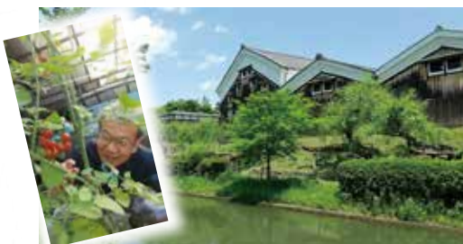
▲ 家庭菜園や癒しの散歩コース