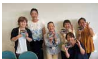
▲ アンガーマネジメントティーン 講座を行いました