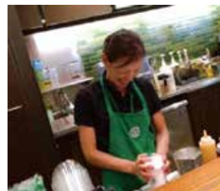
▲ 大手カフェで社員教育をしていた頃