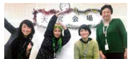
▲ 日本アンガーマネジメント協会 カンファレンス大会会場 2022 年