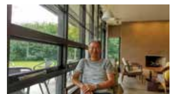
▲ やってよかった アンガーマネジメント

「怒ることは悪いことではないです、怒ってもいいのです」、最初こんな声をかけてもらい、アンガーマネジメントを本気でやろうと決めたあの日。「怒るって大人げない、みっともない、怒りの感情は自分でどうすることもできない」、ではなかったのです。多くの仲間とつながり、学びを深めるたびに笑顔が増えました。アンガーマネジメントと出会えたことに感謝しています。心身ともに健康な人生を歩み続けるヒントがここにあります。