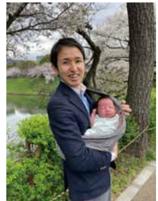
▲ 危機を乗り越えて第二子誕生

アンガーマネジメントを通して、「チャレンジした先に見える新しい世界」を皆さんにも見ていただけたらと思います。