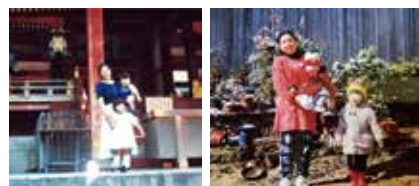
▲些細なことにも爆発していたころ

この人は何を言っているんだろうと思いました。この人の話を聞いてみたいとアンガー・マネジメントファシリテーター養成講座に申し込みました。この出会いが私を救ってくれたと思います。