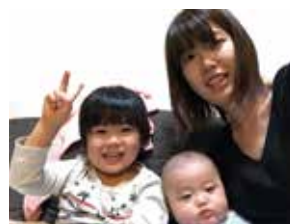
▲ 次男を出産してすぐ。一番イライラしていた時期

受講してみると、仕事だけではなく子育てでも役立つと思いました。アンガー・マネジメントファシリテーター養成講座の中で怒りの感情がなぜあるのか、人はなぜ怒るのか、怒りの感情のメカニズム等を学び、「そうだったのか！」ととても腑に落ちました。これまで自分を責めていたけれど、理論的に怒りの感情について考えることができるようになりました。そしてそれを私も伝えて行きたいと思うようになりました。