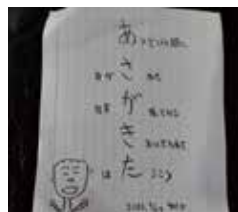
▲ あさがきたの詩～ 熟睡して目覚めた朝。 仕事への決意を詩に しました