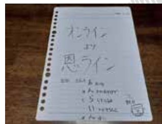
▲ オンラインより恩ラインの詩～ オンライン化が進む昨今。そのオンラインも大事ですが、それ以上に大事なのは人の恩に感謝すること。その思いを詩にしました

資格が取れる講座だと知ったのは受講してから。資格を取得するつもりはなかったのですが、それでも講座を受講したことは自分にとってとても大切なことでした。