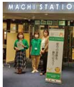
▲ 日本アンガーマネジメント協会の仲間たちと

聞こえない私の人生はまだまだ続いていきますが、笑顔でアンガーマネジメントをお伝えしていきたいと思っています。