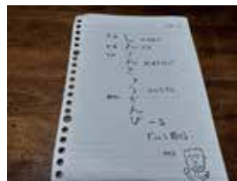
◀ しんぶんきゅうかんぴの詩～ 新聞休みの月曜日。配達員さん に思いを寄せて作った詩です